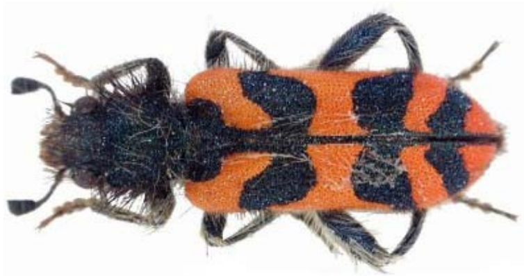
Trichodes umbellatarum (Olivier, 1795)*