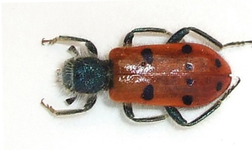
Trichodes octopunctatus (Fabricius, 1787).