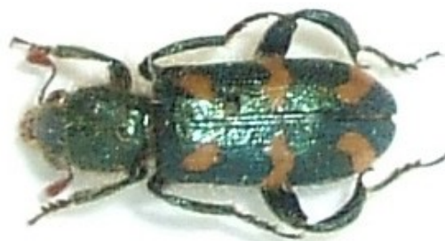
Trichodes flavocinctus (Spinola, 1844)