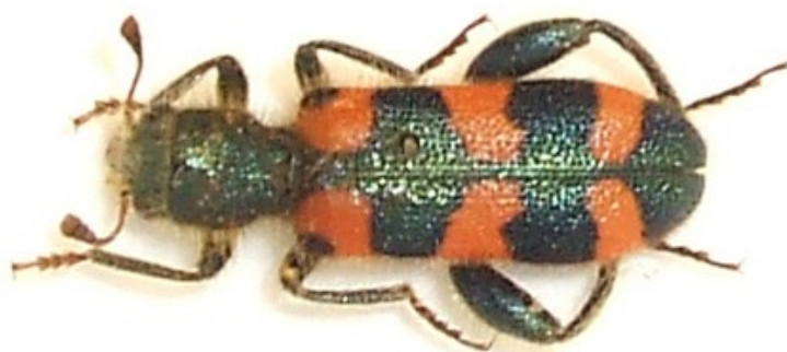
Trichodes leucopsideus (Olivier, 1795)