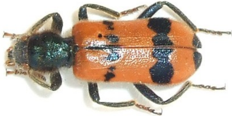
Trichodes apiarius f.i (Linnaeus, 1758)