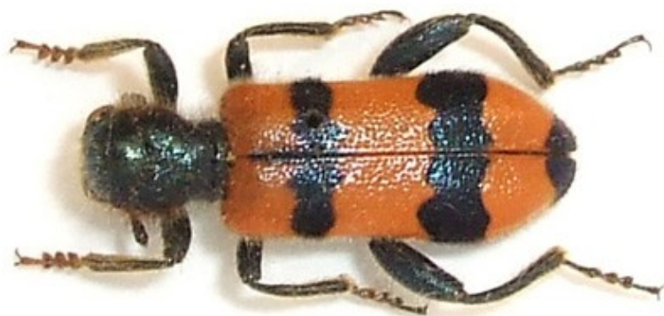
Trichodes apiarius (Linnaeus, 1758)