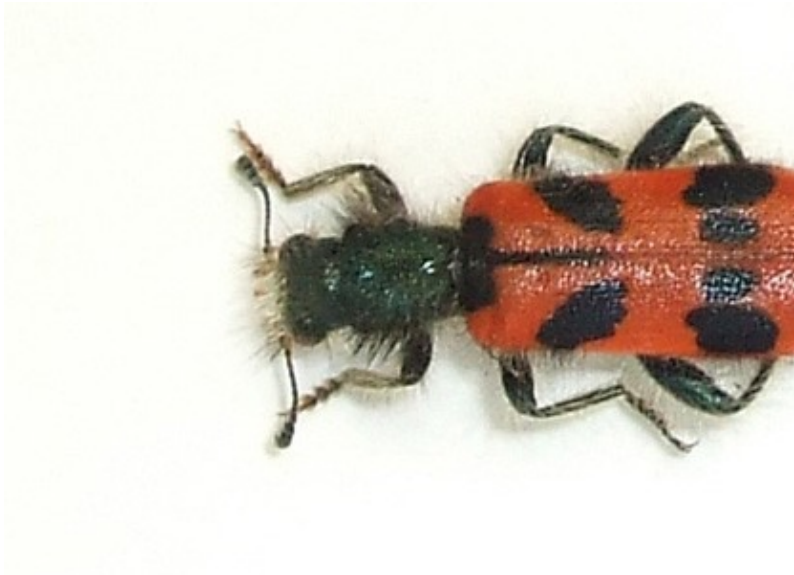
Trichodes alvearius f.i (Fabricius, 1792)