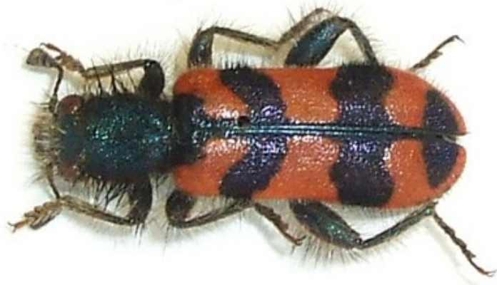
Trichodes alvearius (Fabricius, 1792)